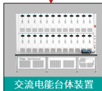
交流电能台体装置