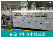
交流电能流水线装置