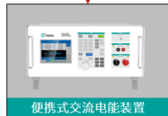
便携式交流电能装置