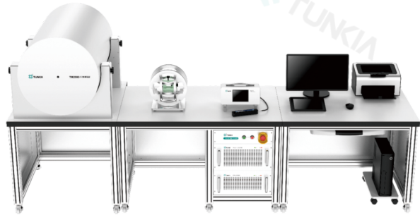
*该图仅供参考,依应用场景不同,配置和细节可能存在一定的差异。